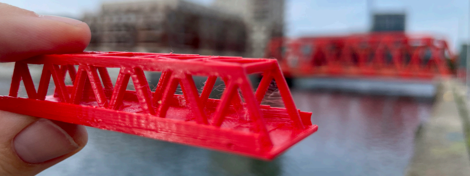
Beijers bro, skala 1:500. I bakgrunden syns originalet mellan Ångfärjekajen och Beijerskajen i skala 1:1.

FASTIGHETS- OCH GATUKONTORET AUGUSTI 2024